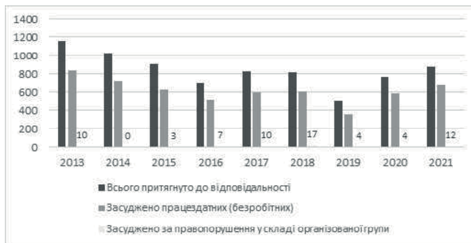
Рис. 4. Характеристика засуджених за вчинення злочину, передбаченого ст. 246 ККУ

Водночас кількість засуджених осіб за вчинення зазначеного складу злочину у складі організованих груп є малозначною (від 3-х до 17-и), що додатково дає підстави стверджувати про невідповідність кримінально-правової державної статистики та реальність кримінальних проблем у лісовому господарстві країни. Кримінальна статистика вказує, перш за все, на проблеми соціально-економічного характеру, що виникають на тлі бідності окремих верств населення, їх безробітного стану та потреби виживання шляхом приватної заготівлі деревини в лісах. Водночас системні кримінальні явища у сфері лісового господарства залишаються поза увагою органів правопорядку та відповідних кримінологічних досліджень.