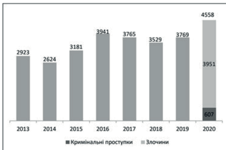
Рис. 3. Кримінальні правопорушення проти довкілля

Наразі на фоні загальної тенденції до зростання чисельності виявлених кримінальних правопорушень проти довкілля абсолютну більшість цих посягань у 2020 році становили випадки незаконної порубки або незаконного перевезення, зберігання, збуту лісу (ст. 246 ККУ), причому їх відсоток за період, що розглядається, збільшився із 33,6 % до 56,0 % (рис. 3).