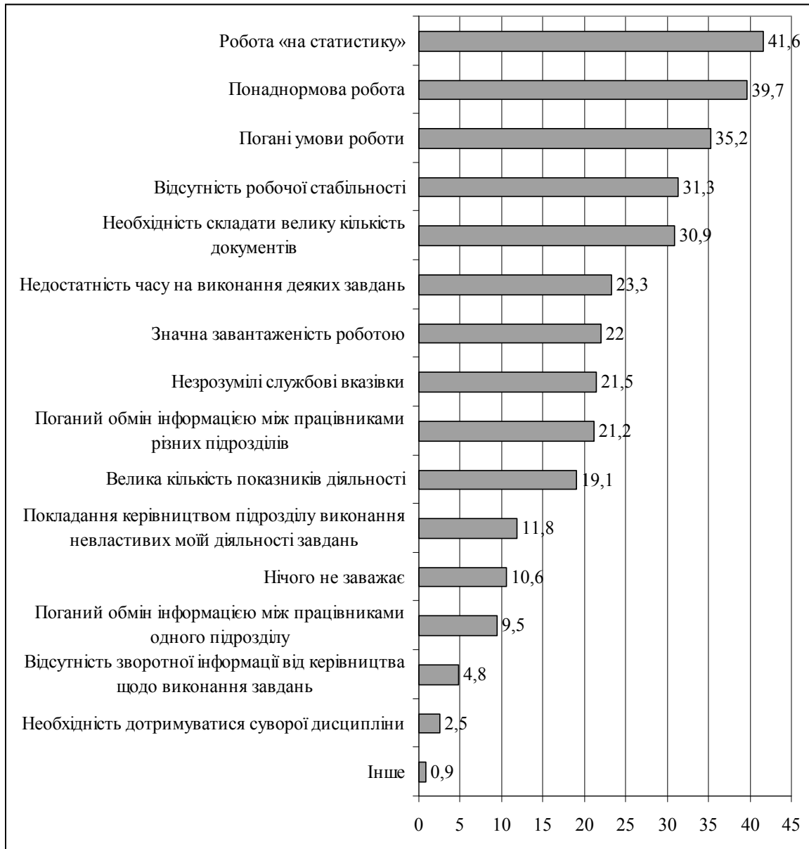
Рис. 3. Явища, які найбільше заважають у щоденній роботі/службі, %

Серед явищ, які найбільше заважають у щоденній роботі/службі та впливають на загальний рівень задоволеності, на підставі застосування дерева класифікації, можна виокремити такі: