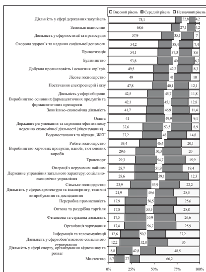
Рис. 1. Рівні криміналізації сфер економіки

Такий розподіл відповідей стосовно цих сфер було отримано в результаті опитування груп респондентів за віком та стажем роботи у практичних підрозділах, проте існує значна розбіжність у відповідях серед тих, хто вважає незначним рівень криміналізації сфери інформації і телекомунікацій та обов'язкового соціального страхування, зокрема серед вікових груп 20–30 років і 40 та більше років. Кількість тих, хто вважає рівень криміналізації у сфері інформації і телекомунікацій незначним, серед респондентів віком 40 років і більше складає 42 %, серед респондентів віком 20–30 років – 32,4 %; а у сфері обов'язкового соціального страхування відповідно 39,1 % та 30,7 %.